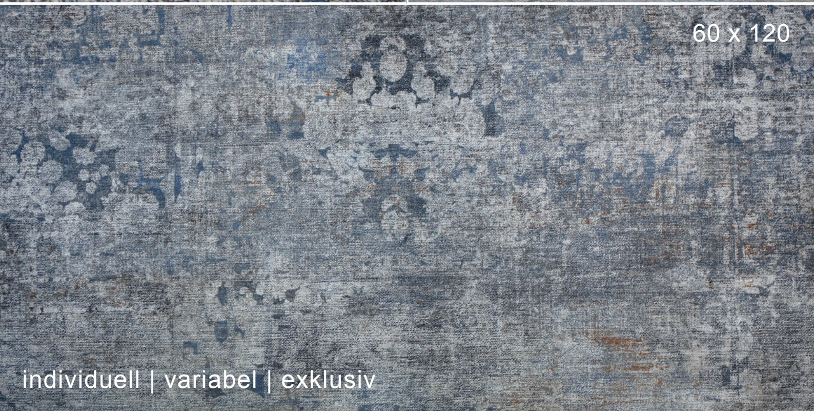
60 x 120