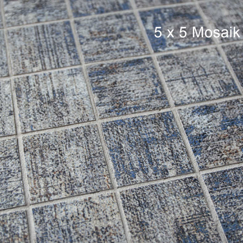
5 x 5 Mosaik